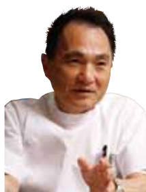
清野 裕，医学博士 第九届IDF-WPR学术大会 主席 IDF-WPR主席 AASD主席